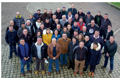
Les collaborateurs transports avec leurs collègues des carrières et de la maintenance.