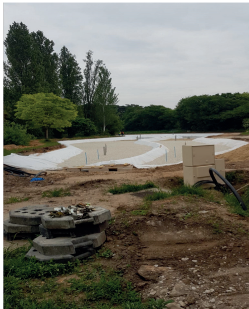
Chantier du BOIS DE BOULOGNE Départ des matériaux : NAVEIL en 40/70