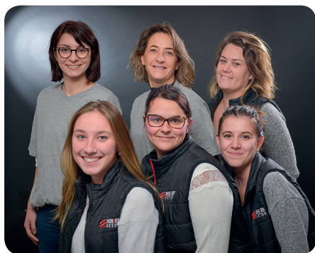
Équipe administrative et comptable Minier Béton.

Toutes les activités ont été impactées par cette forte activité : la production, la qualité, le transport, la maintenance, le commerce et l'administratif.